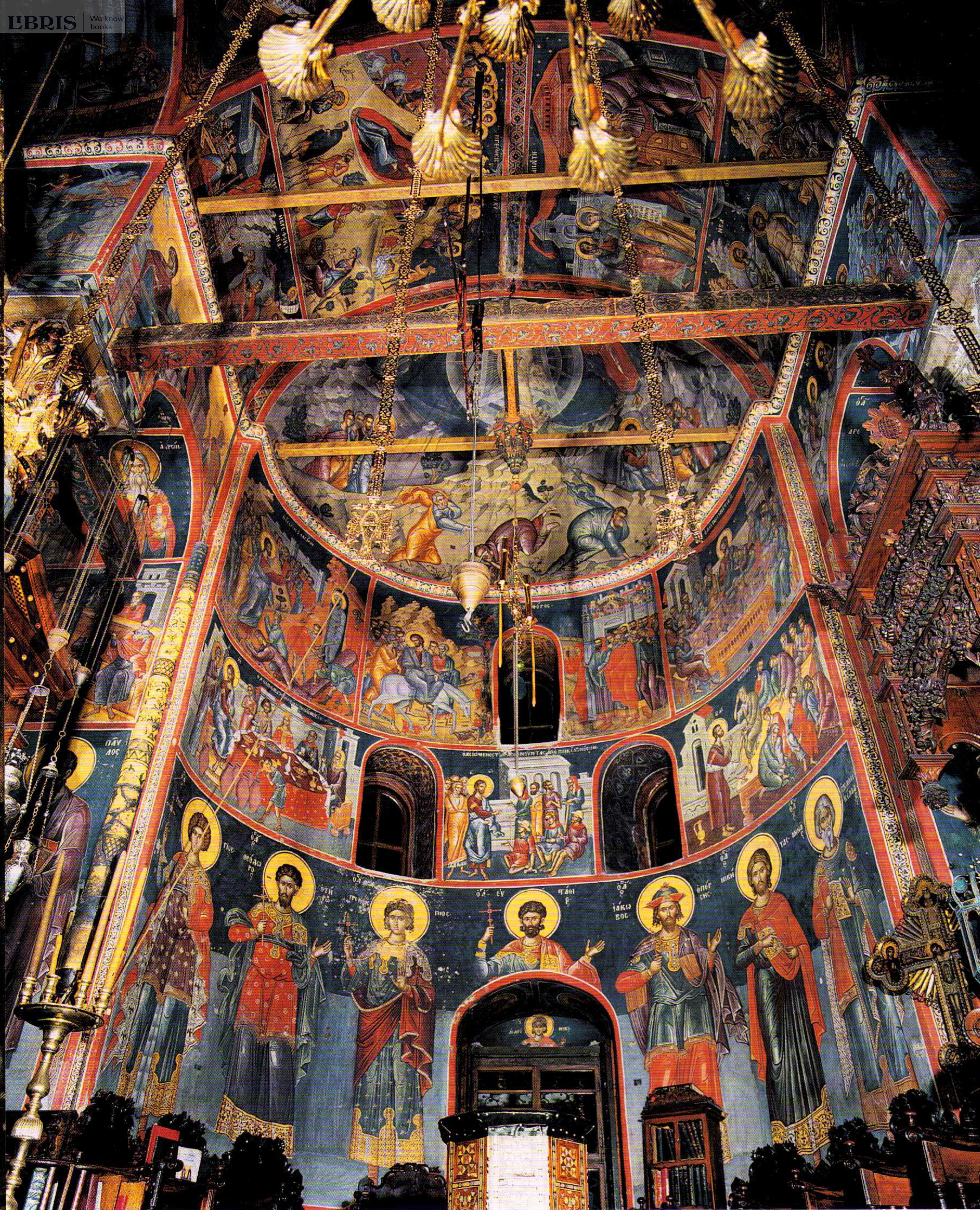
2. Δεξιός χορός