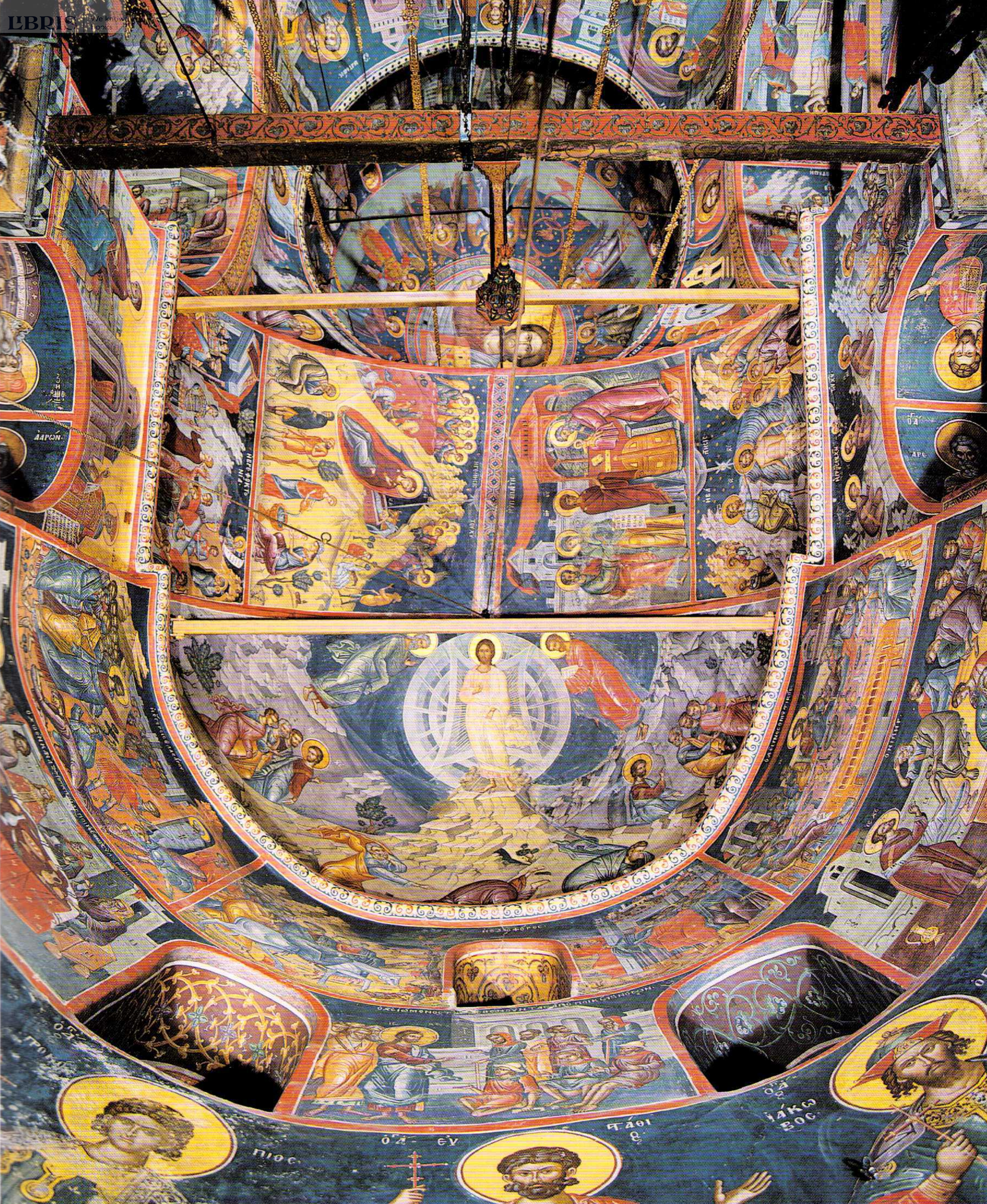
3. Άνοψη τοῦ δεξιοῦ χοροῦ